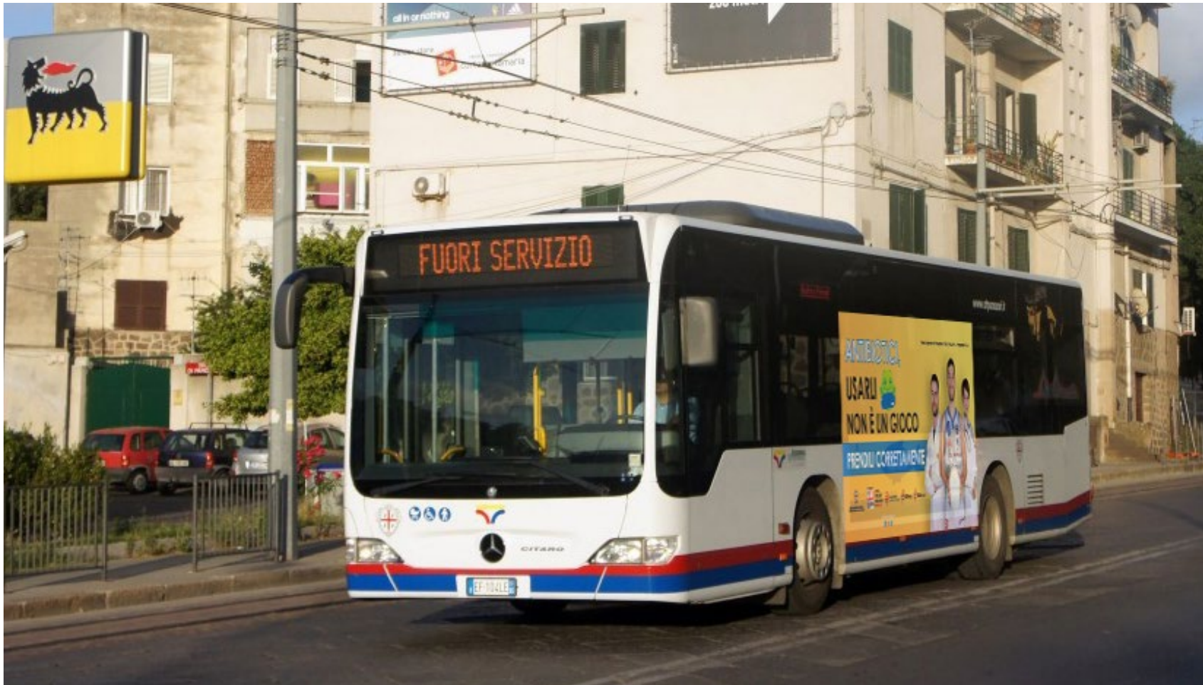
Bus ATP Sassari