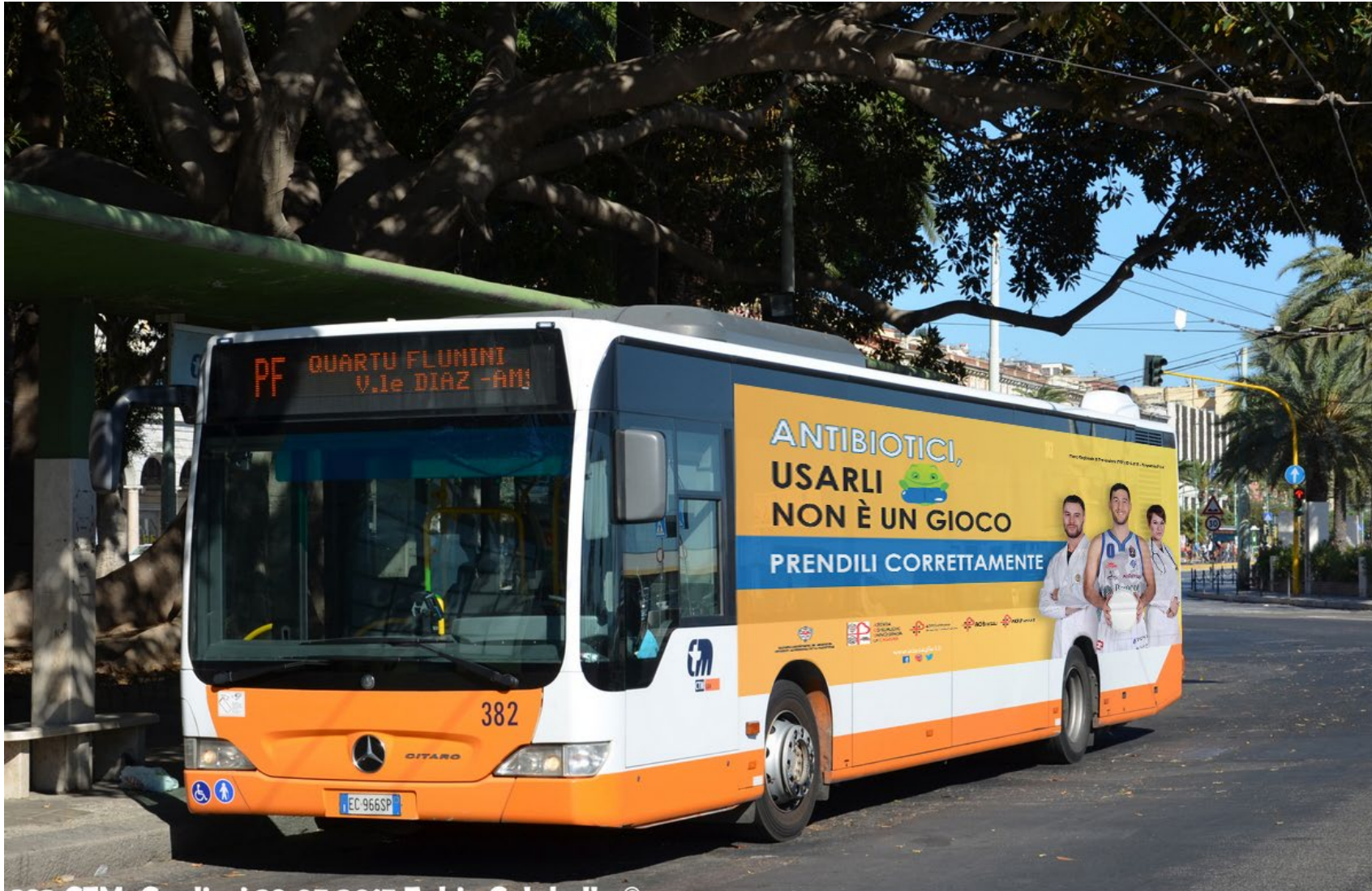
Bus CTM Cagliari