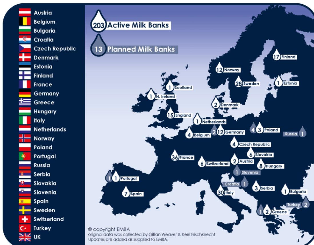
Figura 1. BLUD presenti in Europa

Al novembre 2013, le Banche che operano sul territorio sono 30; si tratta di un numero elevato se confrontato con le realtà degli altri Paesi europei.