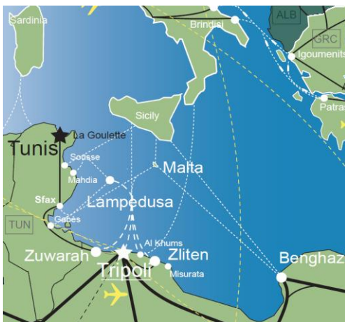
Mapa di flussi migratori irregolari e misti

Giova, in proposito, ricordare che la crisi della primavera 2011 aveva determinato l'arrivo di circa 60.000 persone sull'isola di Lampedusa che, già nel passato, prima degli accordi politici tra Italia e Libia in merito al controllo dei flussi migratori, era stata la meta principale di migrazione per chi ambiva a entrare nell'Unione Europea.