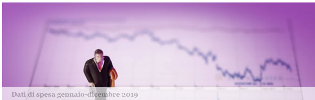
Dati di spesa gennaio-dicembre 2019