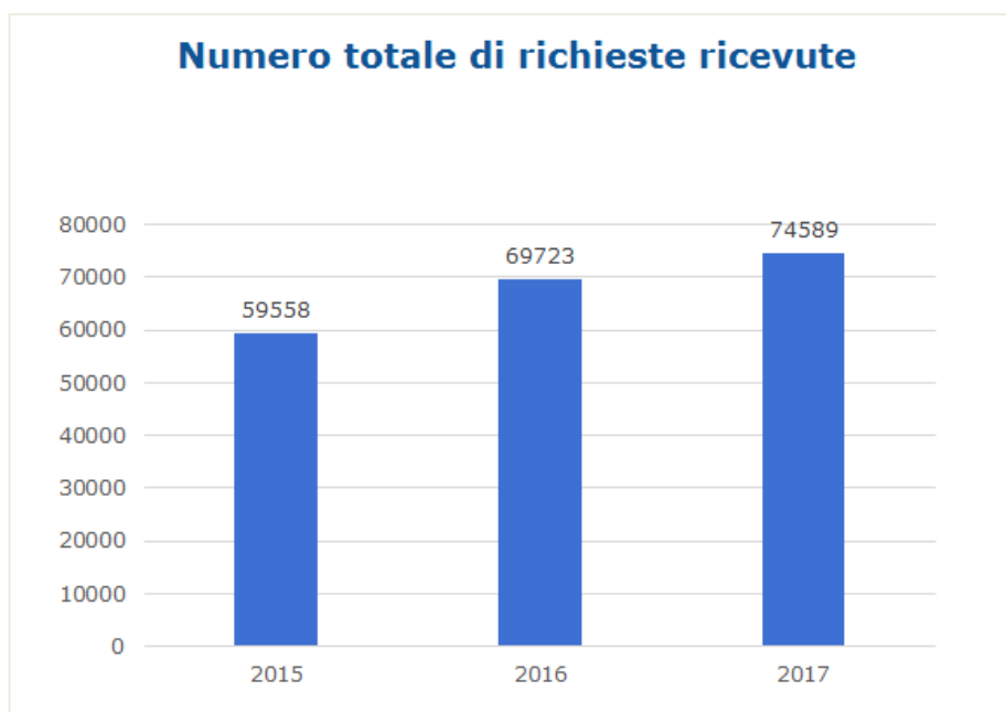
Figura 3: richieste di informazioni presentate ai PCN

Tuttavia, la lenta ma costante crescita del numero di cittadini che si recano all'estero per ricevere assistenza suggerisce che l'aumento delle informazioni disponibili sui siti web dei punti di contatto nazionali ha ridotto il numero delle richieste presentate dai pazienti ai PCN. Analogamente, avendo acquisito maggiori conoscenze sul funzionamento di questo sistema, i medici sono tenuti a fornire essi stessi le informazioni direttamente ai pazienti.