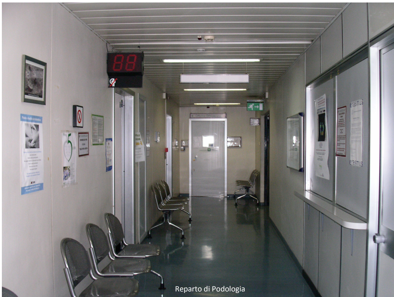
Reparto di Podologia