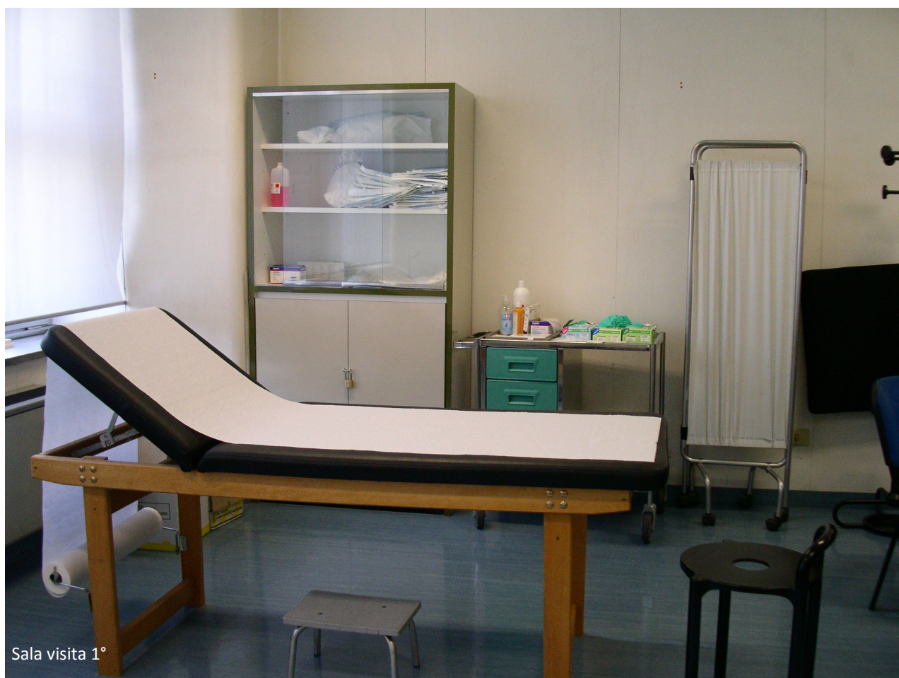
Sala visita 1°