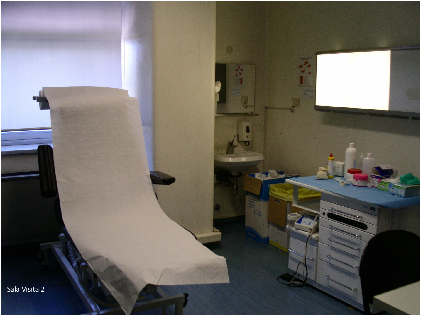
Sala Visita 2