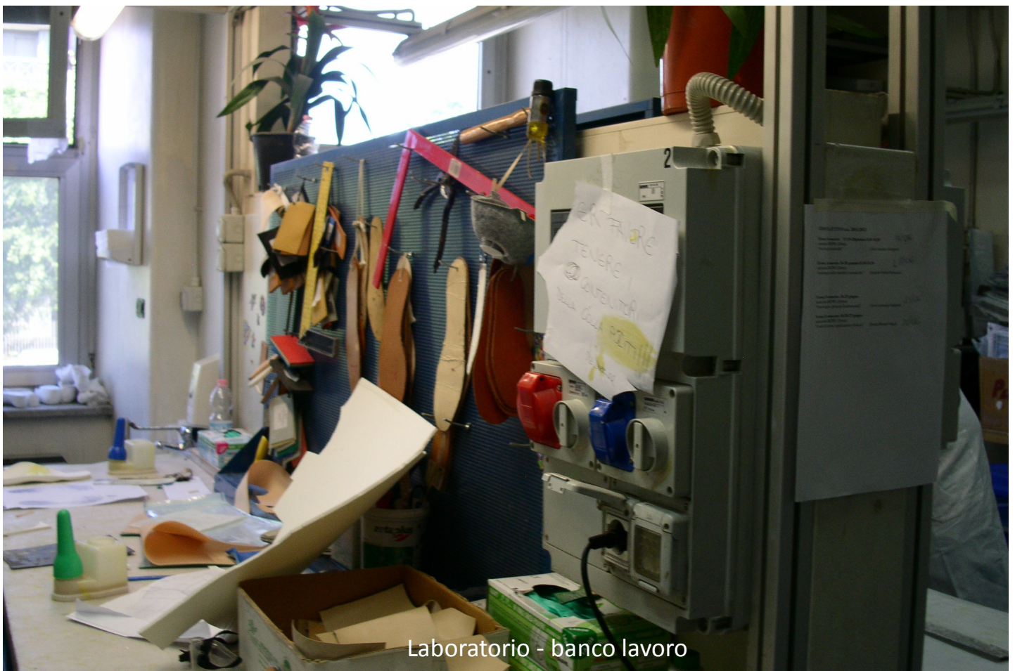
Laboratorio - banco lavoro