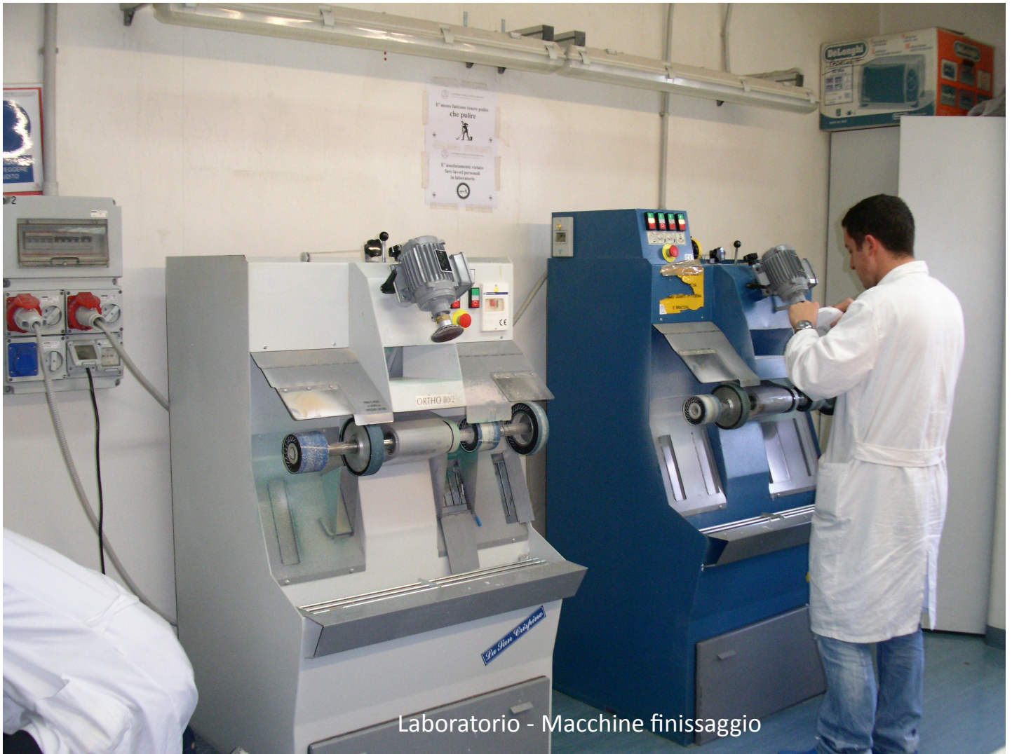
Laboratorio - Macchine finissaggio