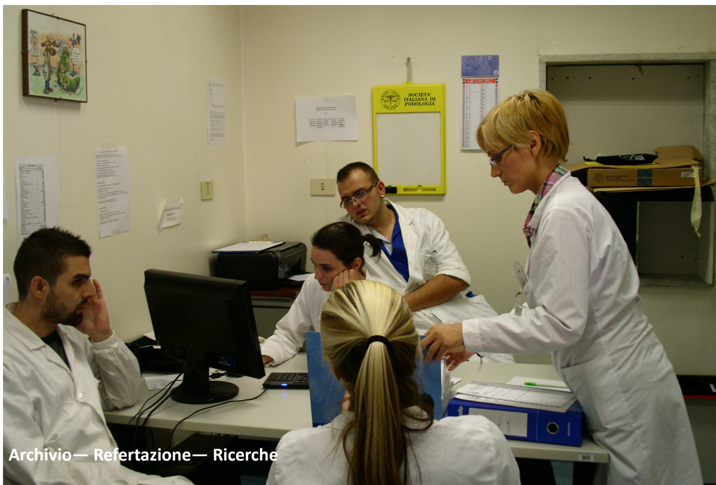
Archivio— Refertazione— Ricerche