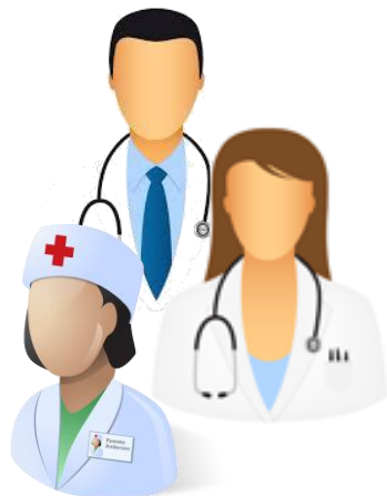
Organizzazione della Medicina Generale

Garantire l'aderenza/appropriatezza al farmaco attraverso la promozione e lo sviluppo di competenze innovative e avanzate