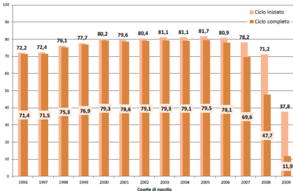
Figura 1: Coperture vaccinali per papilloma virus, per prima dose e ciclo completo. Coorte delle donne nate nel 1996-2009, dati al 31/12/2021.

I dati relativi alle coorti del 2008 e 2009 sono in via di consolidamento in quanto continuano le chiamate per la prima dose e il completamento dei cicli vaccinali avviati.